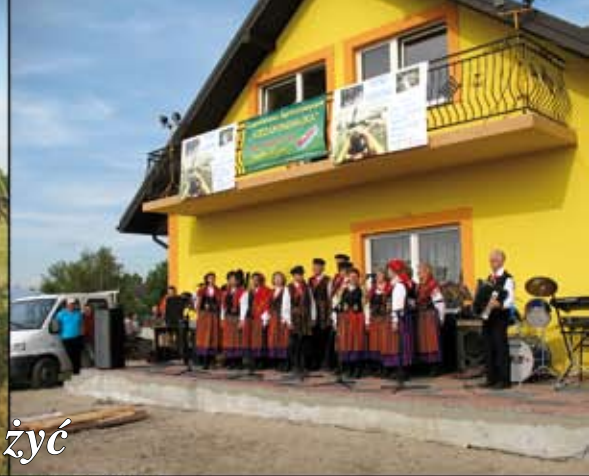
„Szlak Reszków – Muzyka i konie” zaczyna żyć