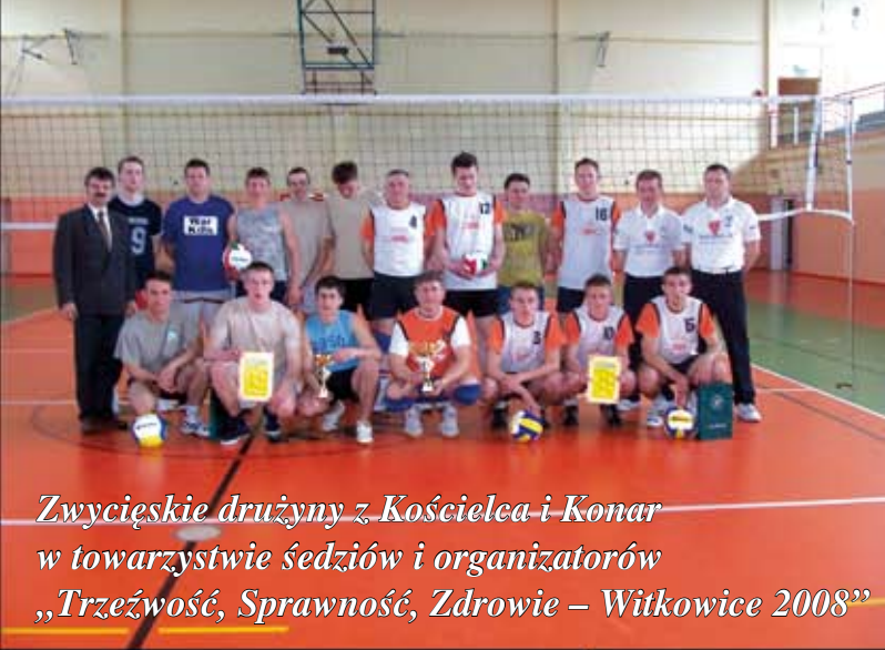
Zwycięskie drużyny z Kościelca i Konar w towarzystwie sędziów i organizatorów „Trzeźwość, Sprawność, Zdrowie – Witkowice 2008”