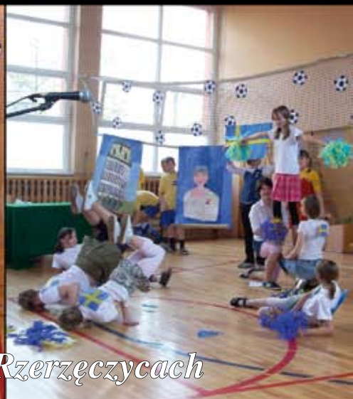
Dzień Języków Europejskich w Zespole Szkół w Rzerzęczycach