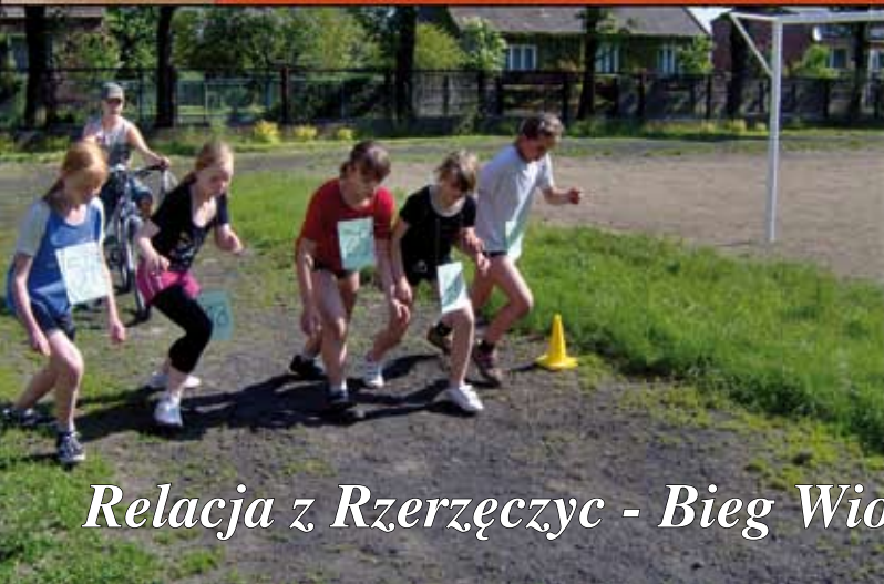
Relacja z Rzerzeczyc - Bieg Wiosenny