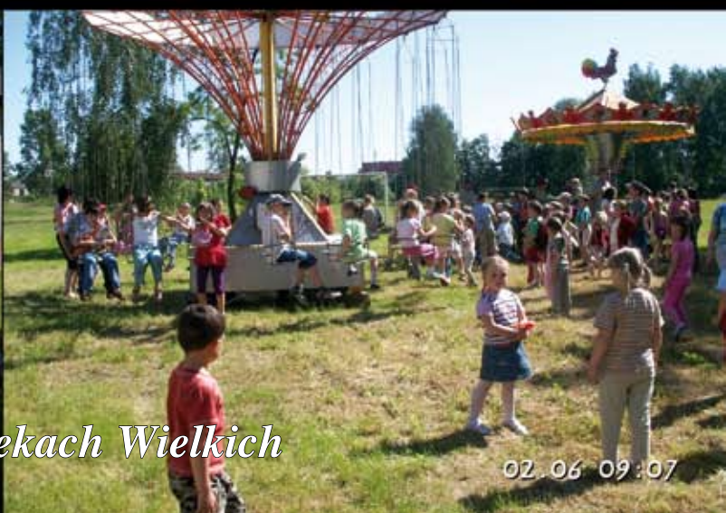
Integracyjny Dzień Dziecka w Rzekach Wielkich