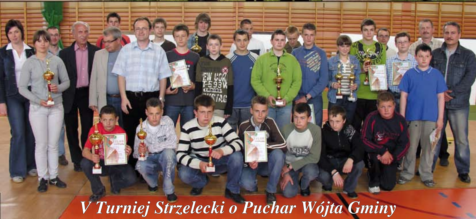
V Turniej Strzelecki o Puchar Wójta Gminy