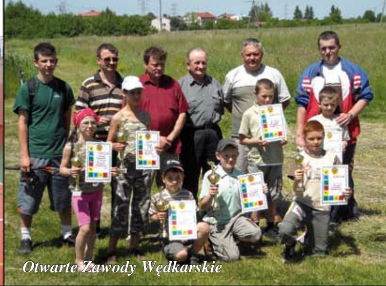
Otwarte Zawody Wędkarskie