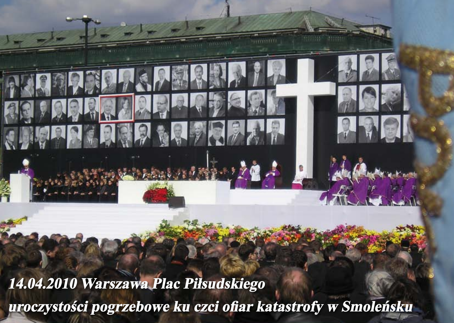
14.04.2010 Warszawa Plac Piłsudskiego uroczystości pogrzebowe ku czci ofiar katastrofy w Smoleńsku