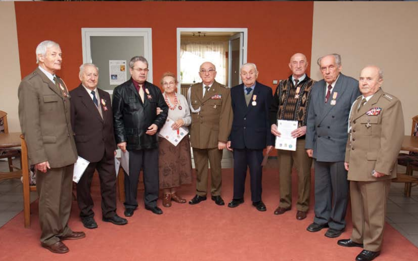
Odznaczenia dla kombatantów