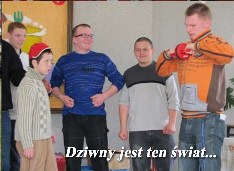
Dziwny jest ten świat...