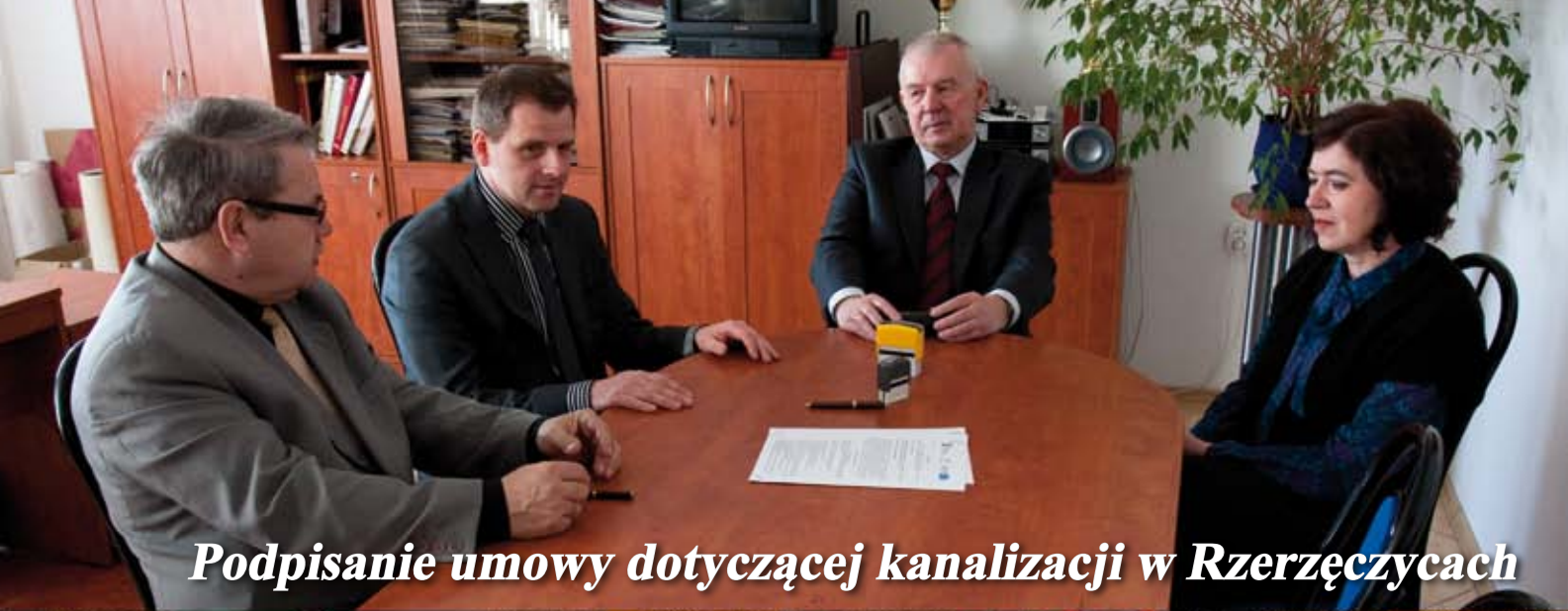
Podpisanie umowy dotyczącej kanalizacji w Rzerzyczkach