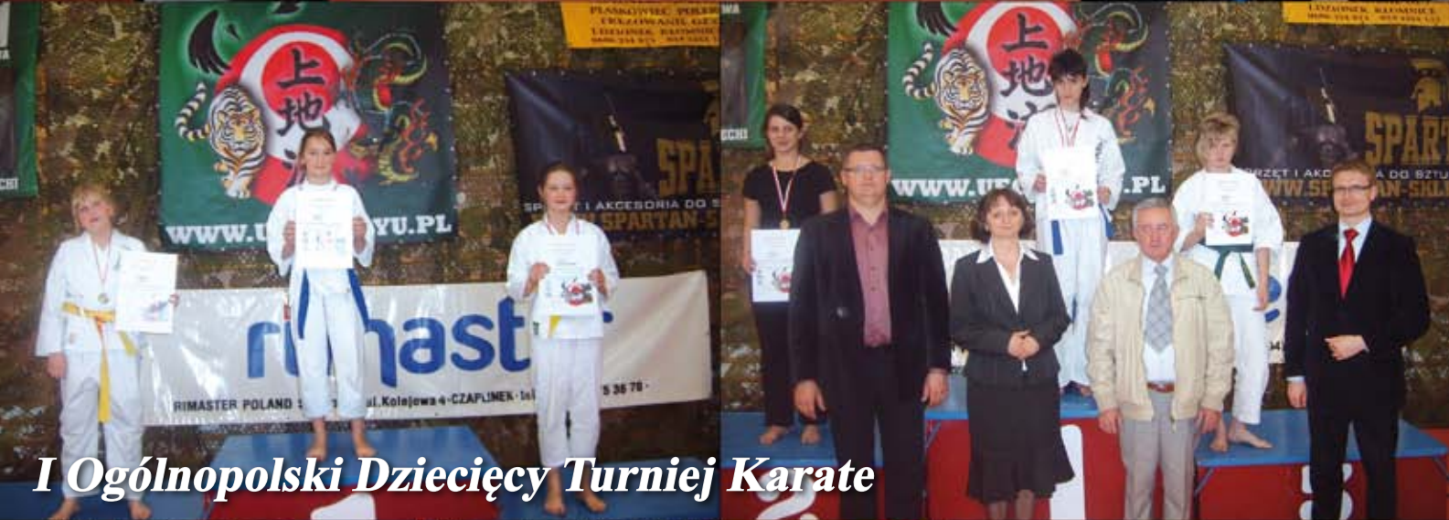
I Ogólnopolski Dziecięcy Turniej Karate