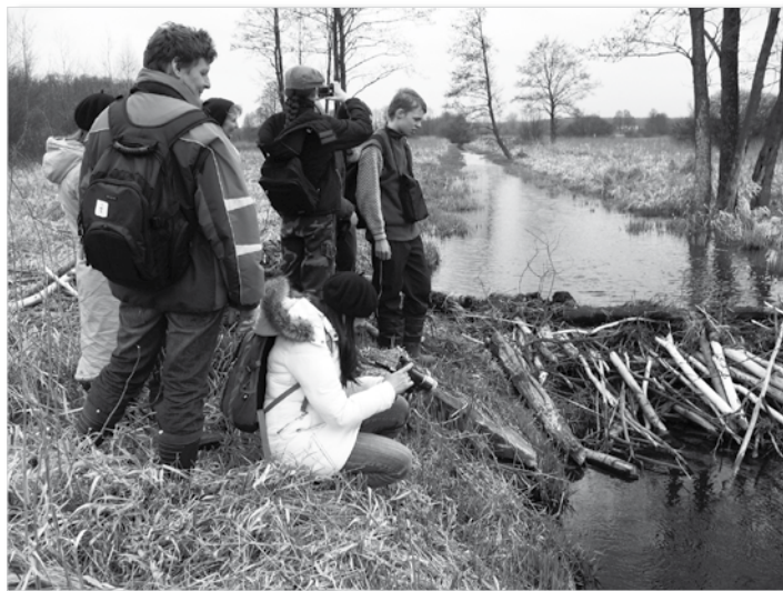
Tama - podziwiamy działanie bobrzej rodziny

Dzięki takim wyprawom uczymy się znacznie więcej, niż z najlepszych podręczników. Kontakt z naturą pozwala docenić jej walory i znaczenie środowiska przyrodniczego dla człowieka. Przyroda jest naszym dziedzictwem, które za wszelką cenę powinniśmy chronić. Obserwowanie jej nie tylko jest ciekawym sposobem na spędzenie czasu ale również uświadomieniem na piękno przyrody najbliższej okolicy.