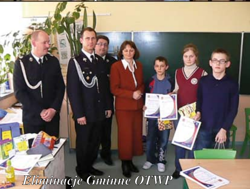
Eliminacje Gminne OTWP