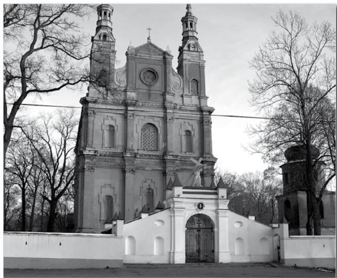
Kruszyna - kościół parafialny

Mam nadzieję, że wyżej opisany szlak spodoba się Wam. Życzę miłych wrażeń podczas wycieczek. ■