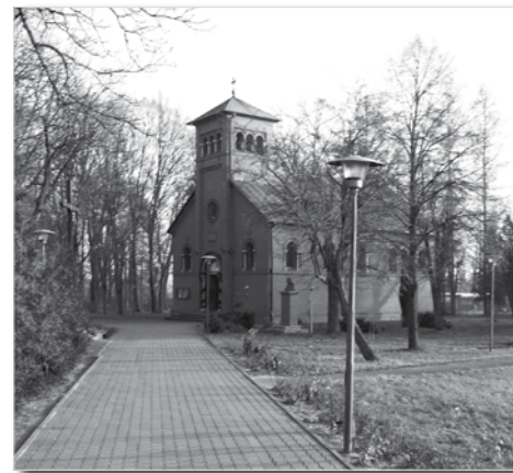
Kościół w Widzowie

i mieszkalne, między innymi wieża ciśniń. W pobliżu kościół parafialny z początku XX w. ufundowany przez Lubomirskich. Po drodze do Jackowa ciekawe kapliczki przydrożne. W samym Widzowie na uwagę zasługuje pomnik ku czci polskich lotników – Żwirki i Wigury na ulicy o tej samej nazwie. Dalej szlak prowadzi szosą przez Jacków by po około 6