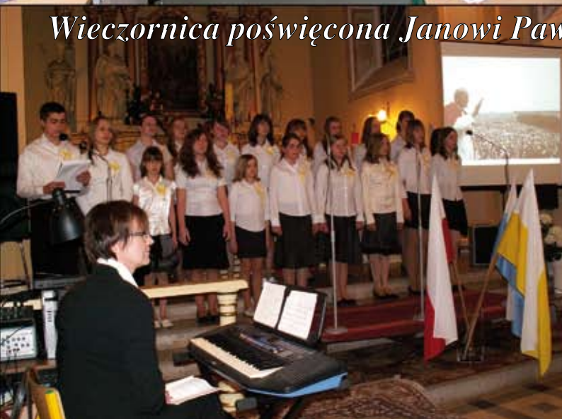
Wieczornica poświęcona Janowi Pawłowi II