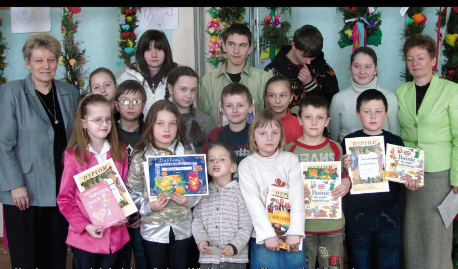
Konkurs na najpiękniejszą Palmę Wielkanocną, Kraszankę i Pisanke.