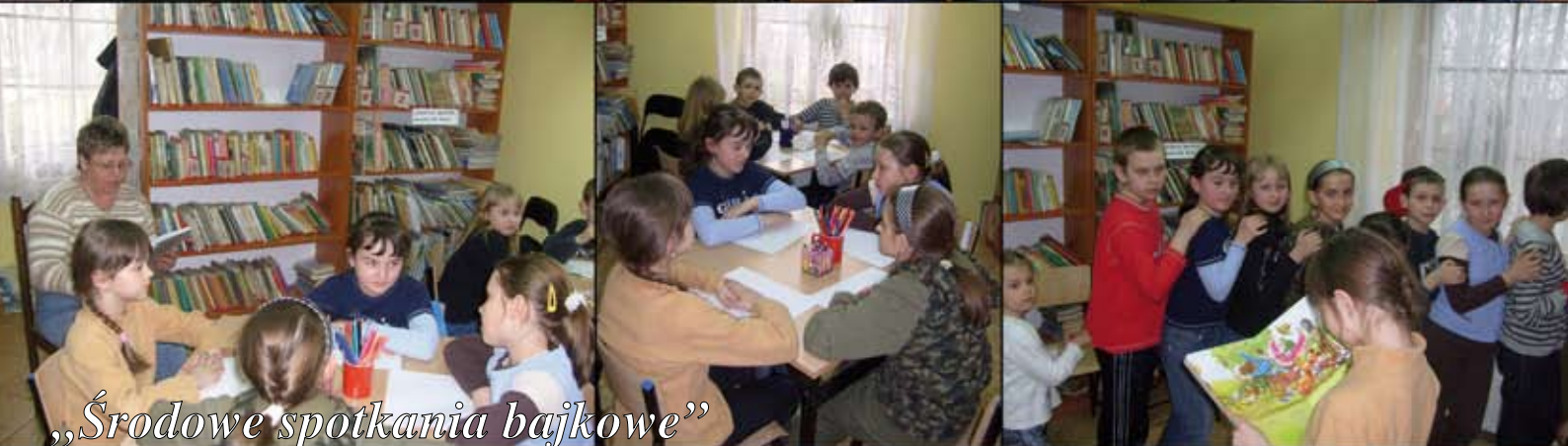
„Środowe spotkania bajkowe”