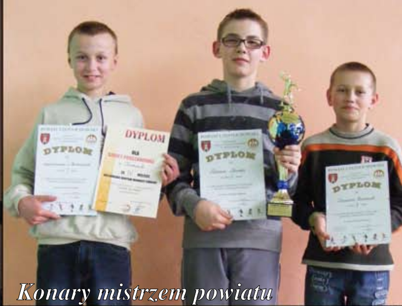
Konary mistrzem powiatu