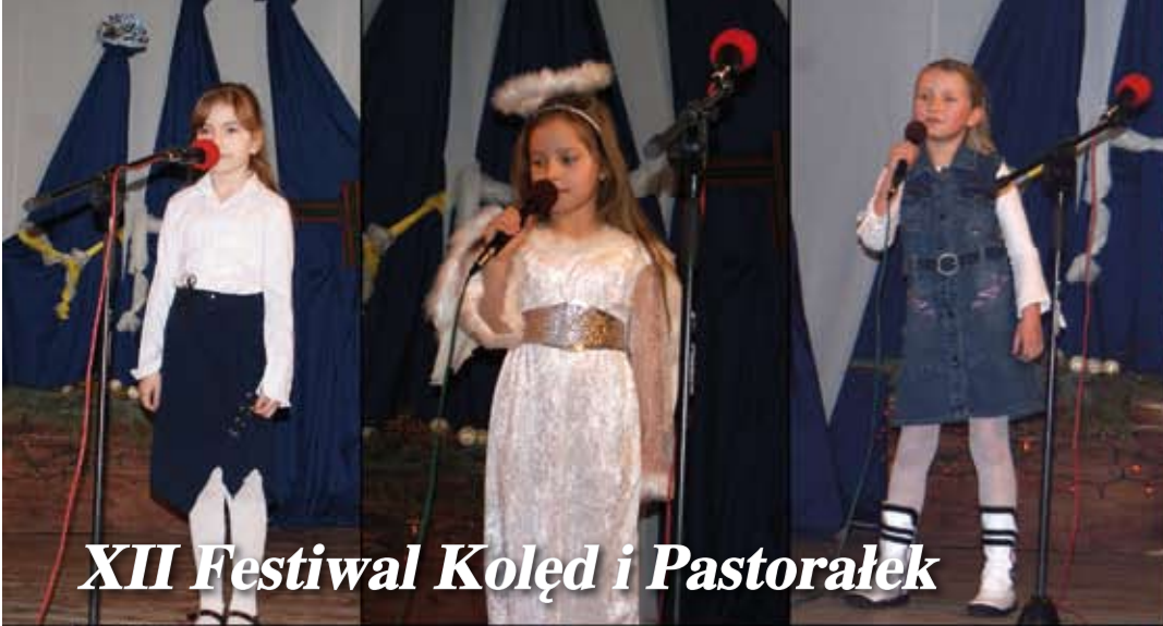
XII Festiwal Koled i Pastorałek