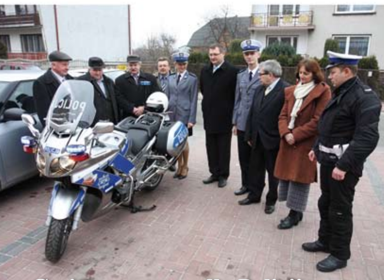
Gminny prezent dla Policji