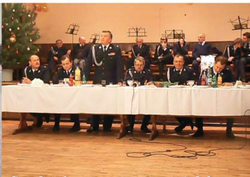
Spotkanie noworoczne strażaków