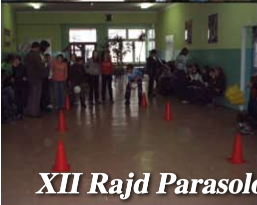
XII Rajd Parasolowy