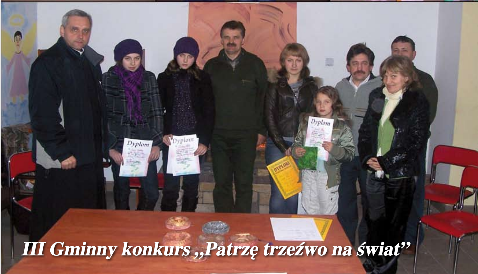
III Gminny konkurs „Patrę trzeżwo na świat”